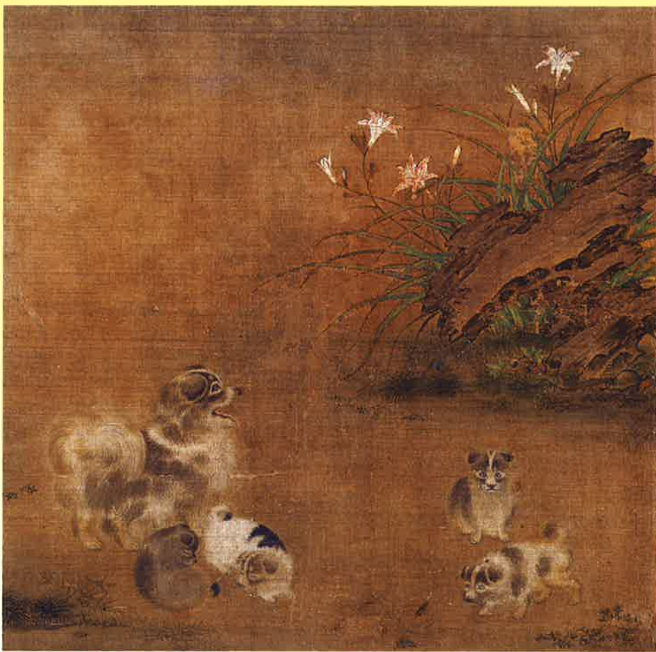
重要文化財 萱草遊狗図 伝毛益筆 中国南宋時代

※20名以上の団体は相当料金の2割引で引率者1名無料 ※「障がい者手帳」をお持ちの方とご同伴者1名2割引