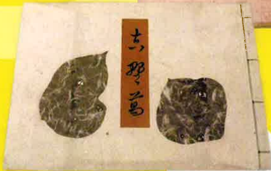
本物の葛の葉を貼り込んだ『吉野葛 潤一郎六部集の内』(1937年刊)