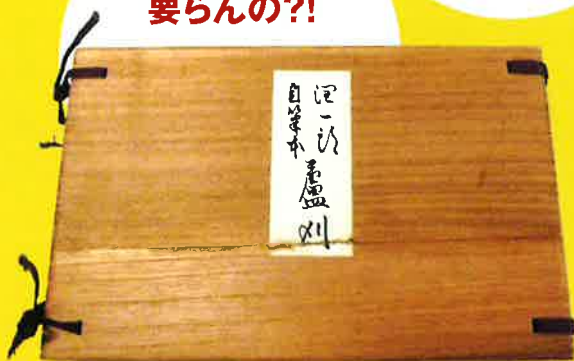
谷崎の自筆を複製した『蘆刈』。貴重な500部限定本だった