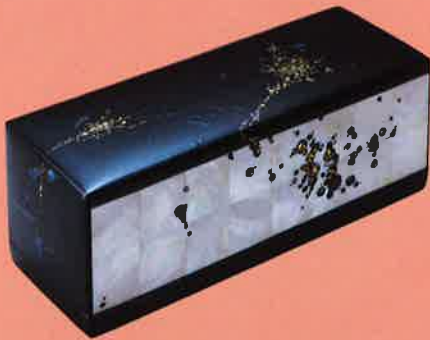
岸本生司「金胎銀細工漆器箱(花箱)」平成25(2013)年 作家蔵