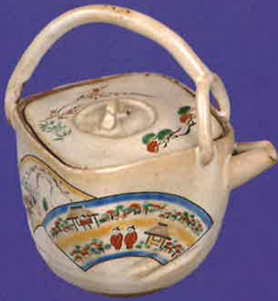
奥田木白「赤膚焼 大和絵酒瓶」江戸時代 公益財団法人 大和文化財保存会蔵