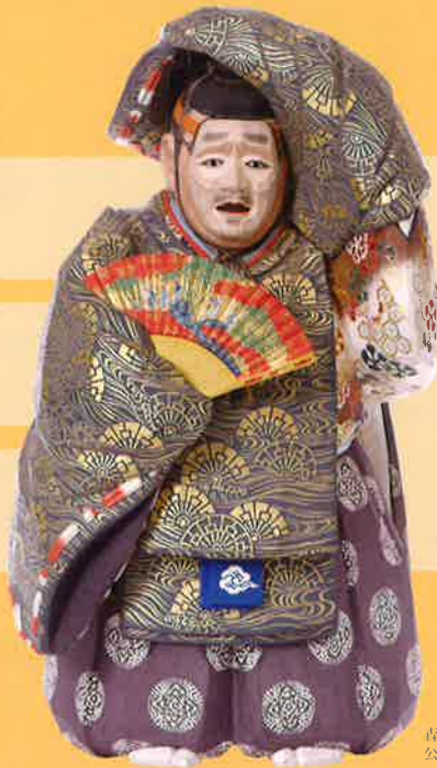
森川柱圃「一刀彫」明治20(1887)年 公益財団法人 名勝依水園・寧楽美術館蔵