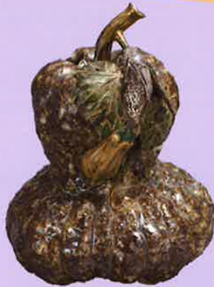
奥田木白「赤膚焼 鐘飾付唐茄子形花器」江戸時代 公益財団法人 名勝依水園・寧楽美術館蔵