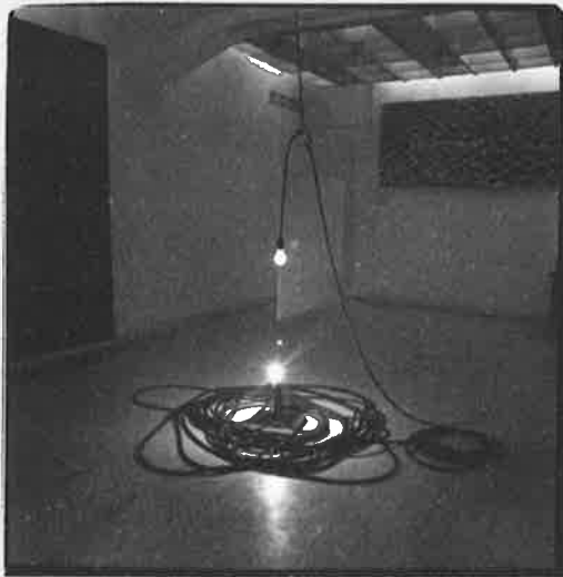
Yoshi da Katsuro may '70 Tokyo Gallery