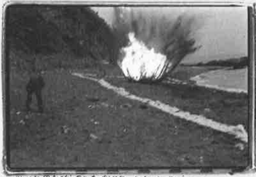
Murata Takashi, Star , 1979, Endless Sun , Anzai Shigeo, Yasuhiko

●次回展……2018年1月21日(日)—5月6日(日)「開館40周年記念展 トラベラー…まだ見ぬ地を踏むために」