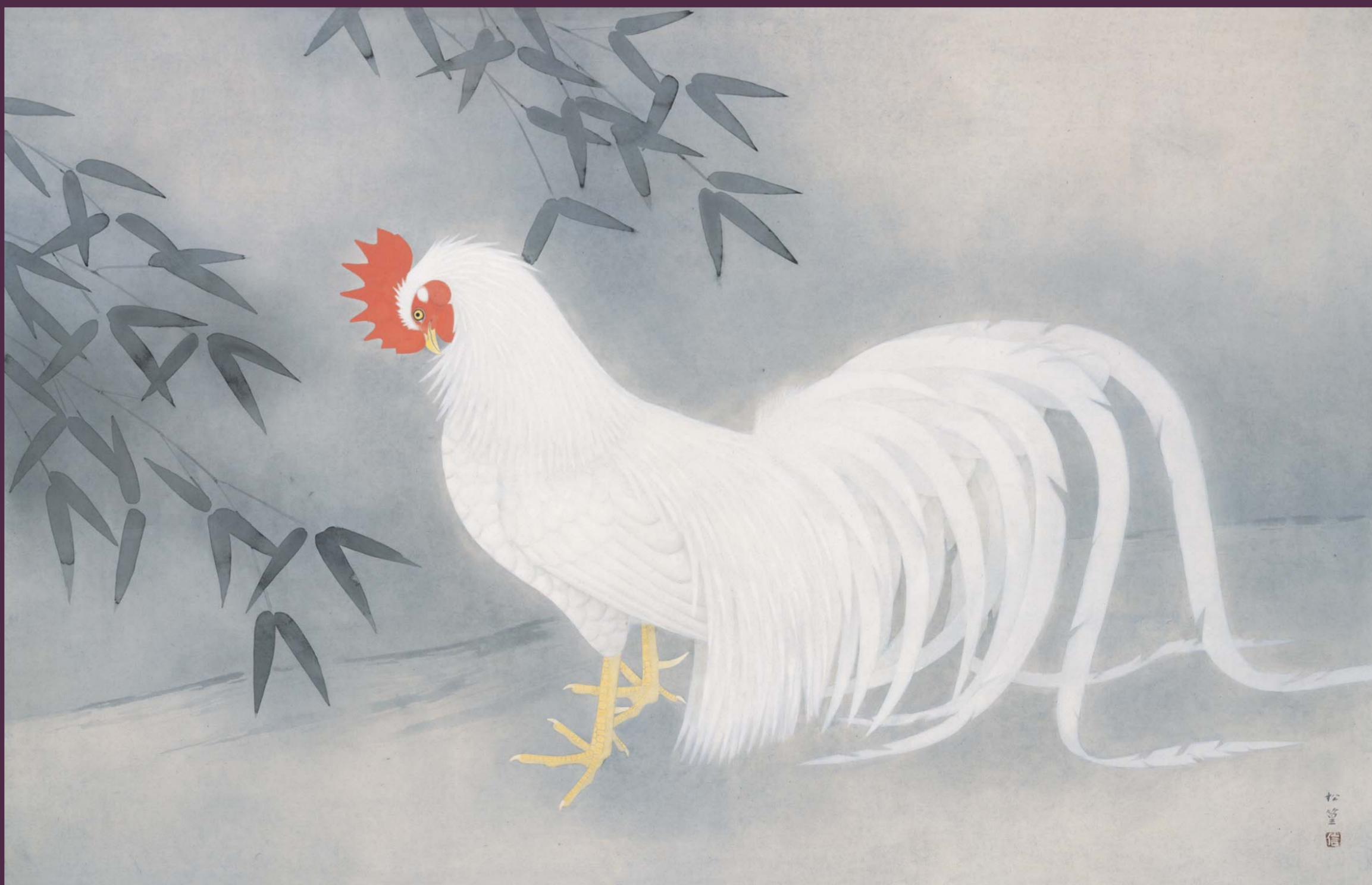
上村松篁「鶏」 昭和48年 前期展示