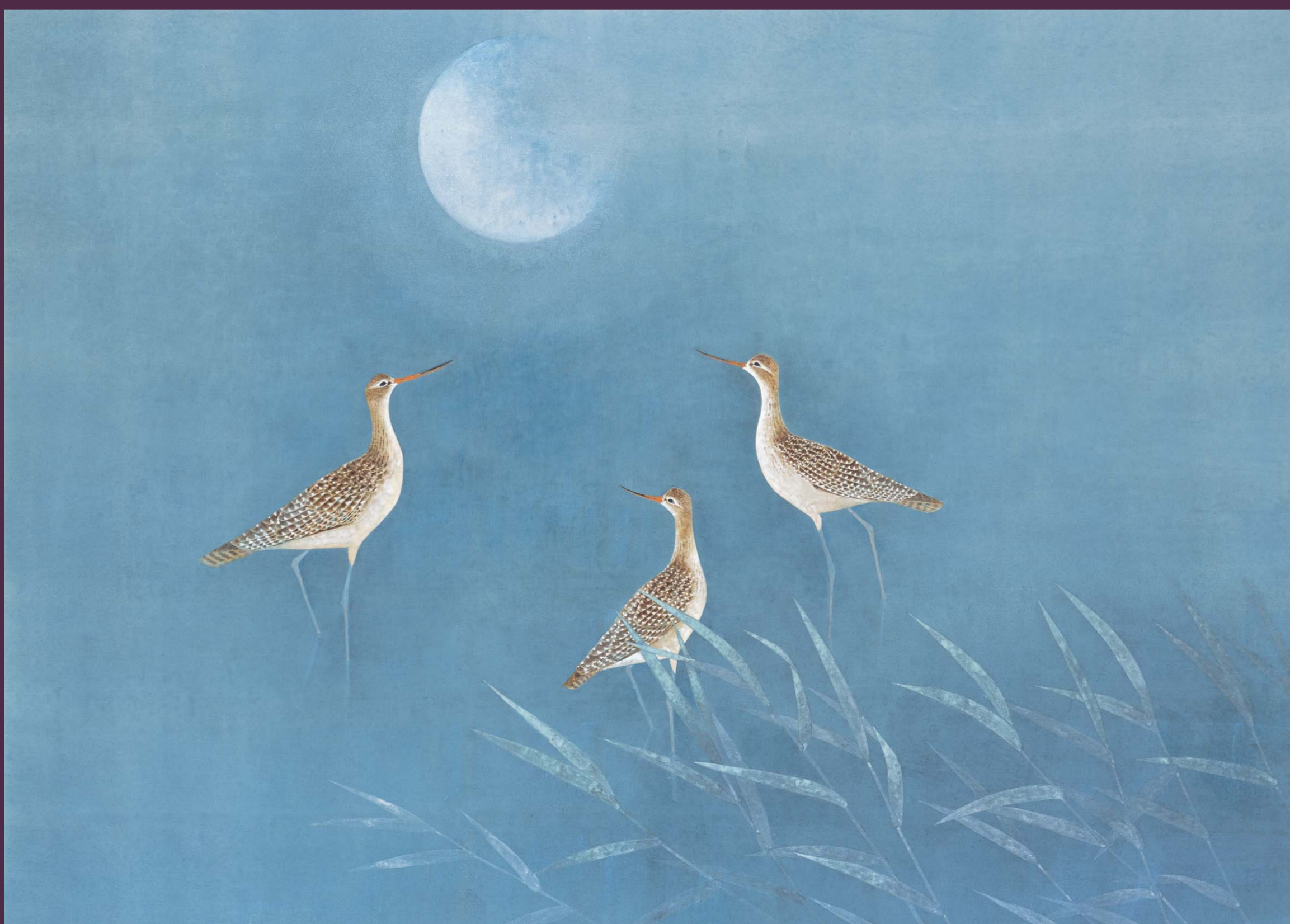
上村淳之「憩」 平成15年 前期展示