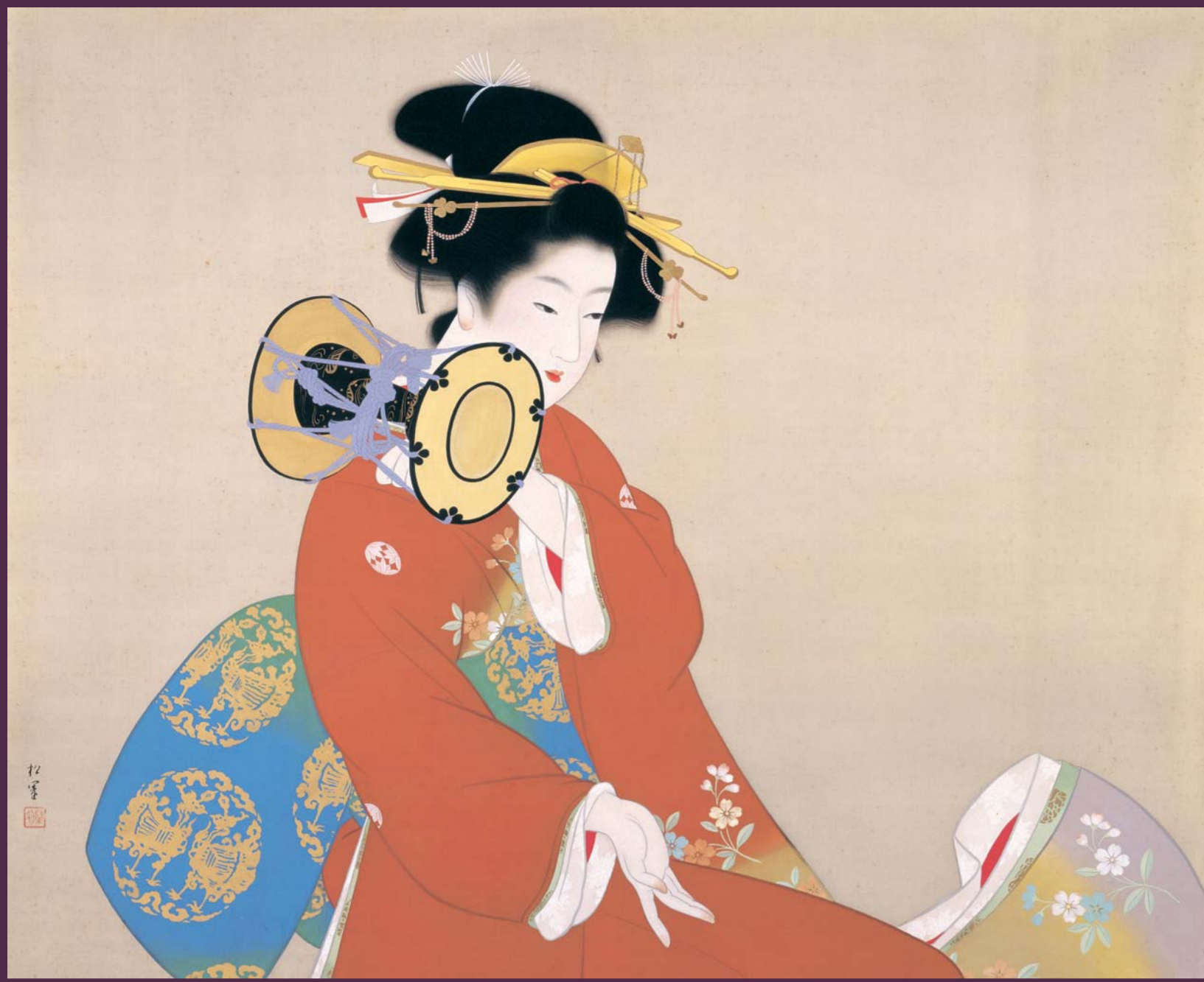
上村松園「鼓の音」 昭和15年 後期展示